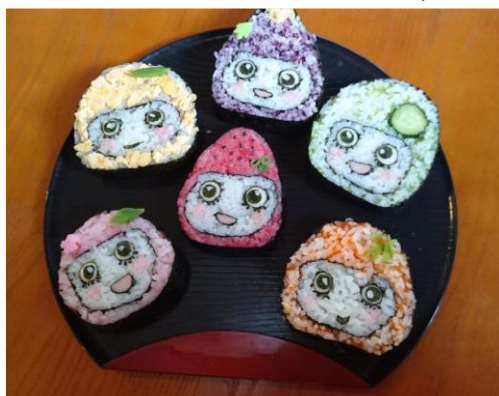
まちおこしのキャラクター「ぶるぶる娘」のお寿司

パンフレットダウンロードについて： http://fruits.oyoyaku.com/app/page/info/20170110puruhaku_panf