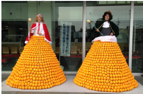
ハッサク王子と姫。衣装を身につけ誰でも写真撮影が可能！