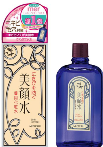
創業のキッカケとなった美顔水 処方 は 132 年前の当時のまま