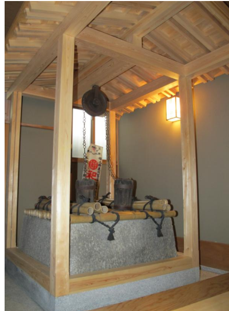
美顔水がつけられた当時の井戸