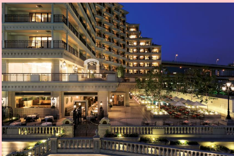
ホテル ラ・スイート神戸ハーバーランド