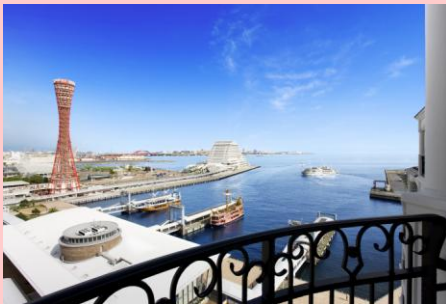
ホテルからの風景