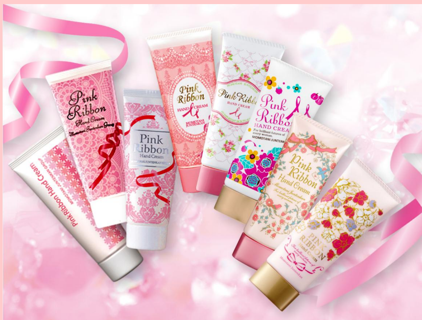
桃谷順天館 歴代8種類のハンドクリーム

毎年デザインと処方を変え、自社でオリジナルの「ピンクリボンハンドクリーム」を企画してきました。収益金はピンクリボン団体へ寄付しており、「寄付になるのなら！」と関心をお持ちいただく方が多くいらっしゃいます。プロジェクトメンバーが中身、香り、デザイン1つひとつこだわりぬいた、数量限定の特別なハンドクリームです。原料選びからすべての製作工程に対して誠実に、丁寧に、そして真心を込めてつくっています。