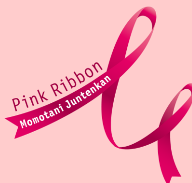
桃谷順天館 ピンクリボンハンドクリーム