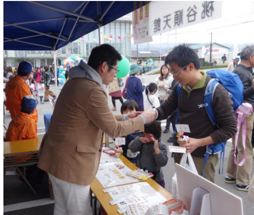
2017年3月に紀の川市イベント「ふる博」にて市民の皆さまに香りとデザインのアンケートを実施！