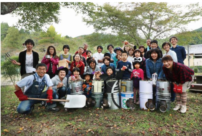
ロケットストーブを DIY！できたてストーブでフルーツを使ったピザなどを焼き、自然をたっぷり満喫！