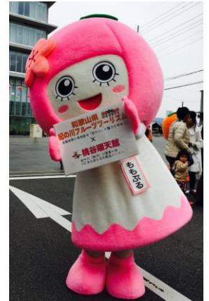
果物のみずみずしさを伝える紀の川ふるふる娘のももぷるちゃん。