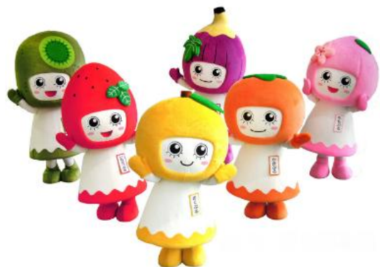
紀の川市のフルーツをPR! 紀の川ふるふる娘たち