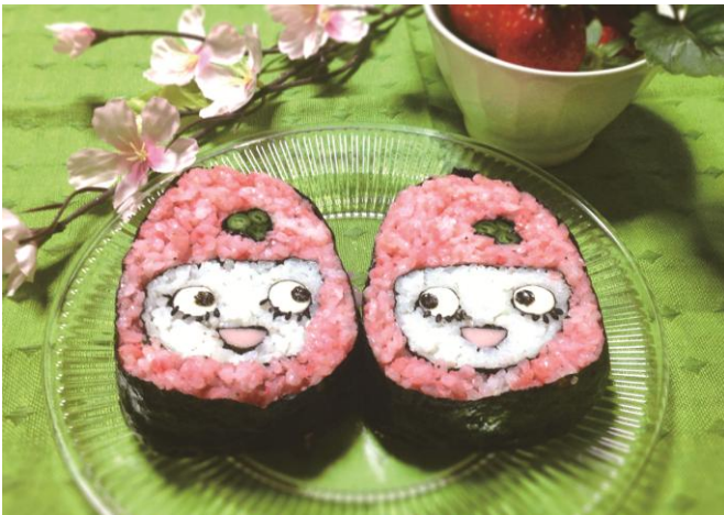
ふるふる娘の 1 人「いちごっふる」のデコ巻き寿司をつくります！見た目も可愛く、切るときに思わず笑顔がこぼれます。