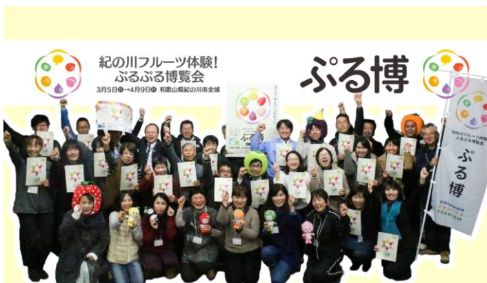
フルーツ・ツーリズムの皆さん

Facebook ページ: https://www.facebook.com/purupuruclub.kinokawa/