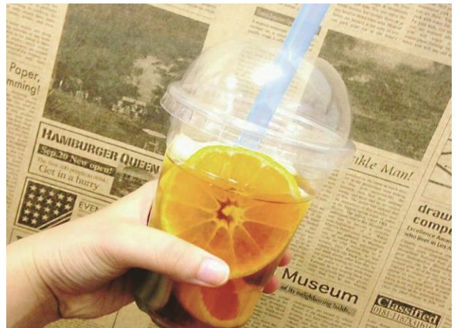
インスタ映えるフルーツのフォトジェニック体験！和歌山大学の学生と一緒にピールアートとフルーツティを作り出来上がりを撮影！