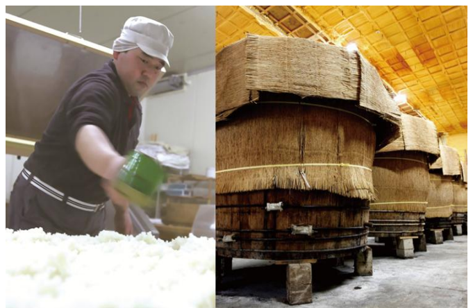
食酢の伝統製法・日本酒製造見学。酎き酢、酎き酒も楽しむことができます！