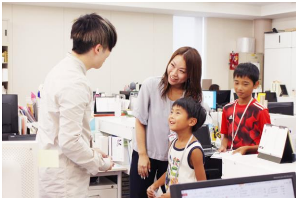
お兄さんお姉さんと挨拶。