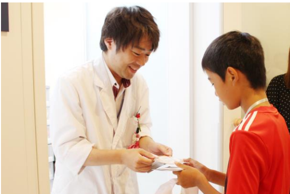
研究員と名刺交換。ドキドキ。