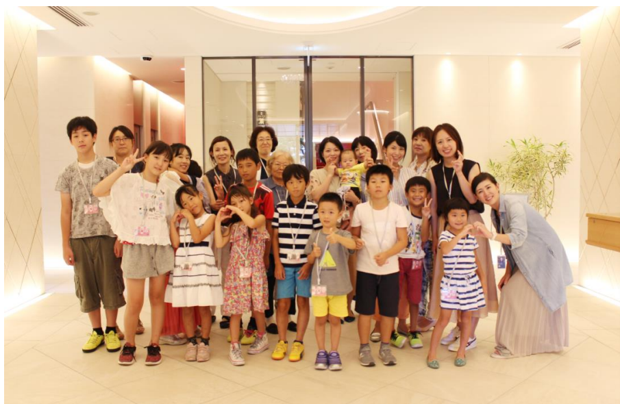
みんなで記念撮影！楽しかったね！