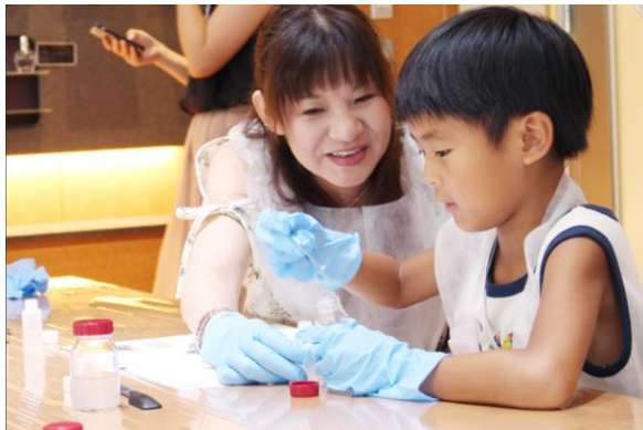
上手にできるかな？