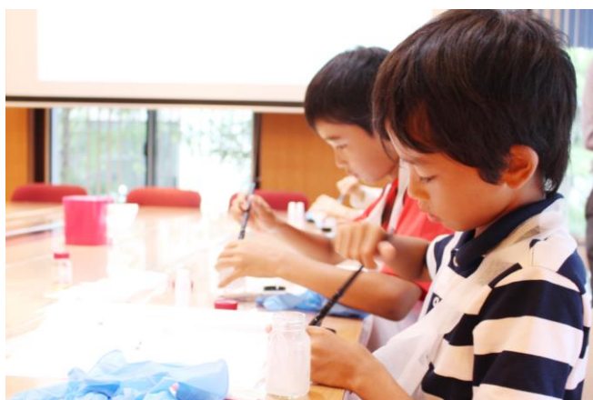
真剣に化粧品をつくる社員のお子様。