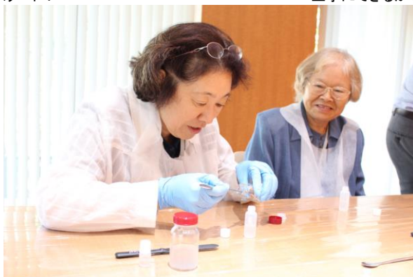
こぼさないようにそろ〜り。