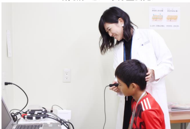
肌の水分量を測定！潤ってるかな〜？