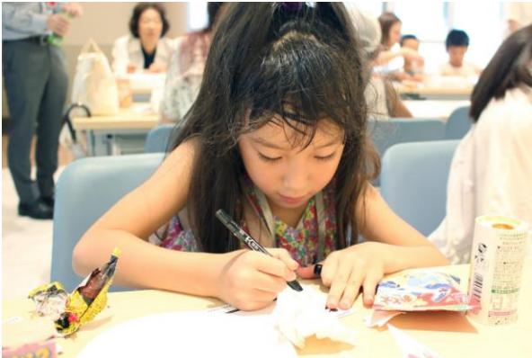
まずは自分の名刺作り！