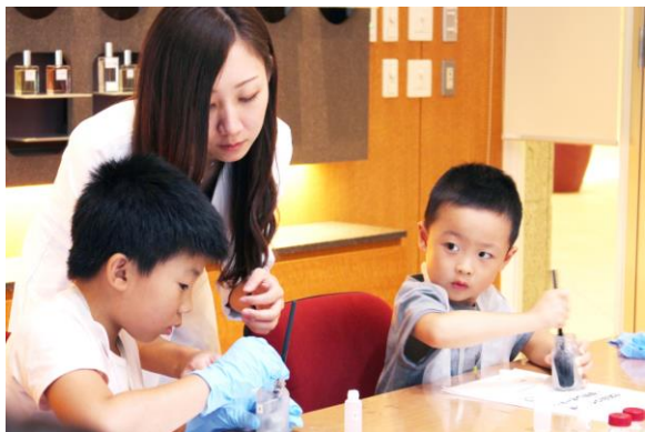
オリジナル化粧品作りスタート！