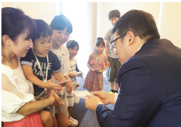
自分たちで作ったオリジナル名刺で専務と名刺交換！

弊社は2016年11月に新たな地に新本社を構えました。社屋が新しくなったこともあり、社員から「妻が新しくなった本社を見たいと言っている」「子供にも働いている場所を見せたい」という声が以前より上がっていました。このような意見を受け、各部署の若手社員達が自ら企画提案し、今回の初めての開催に至りました。弊社には「若手社員のアイデアを活かそう」という風土が根付いており、業務をはじめ社内イベント等でも活かされています。