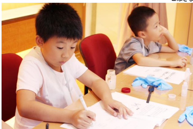
化粧品作りの記録を取り、自由研究に！