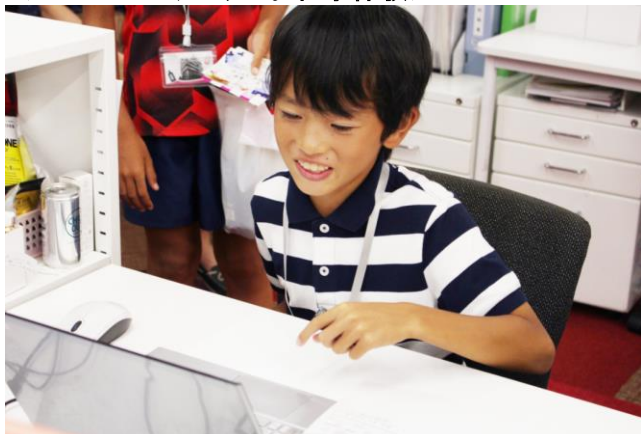
「パパ、ちゃんと仕事してるの？」