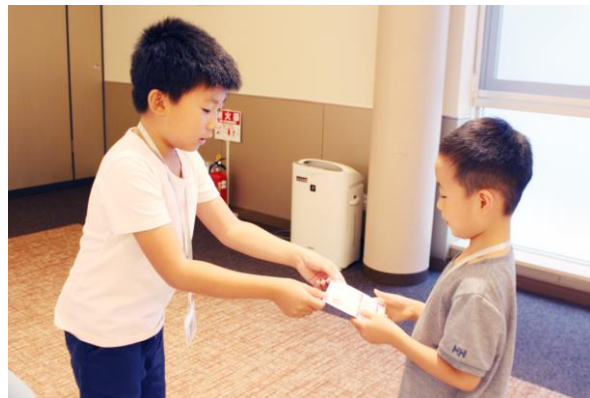
お子様同士で名刺交換の練習。新入社員と一緒にだね。