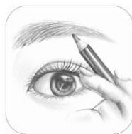
トレミラ Tracing Mirror by 桃谷順天館