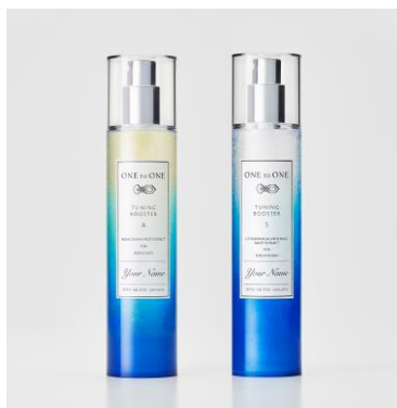
左から チューニングブースター A / チューニングブースター S