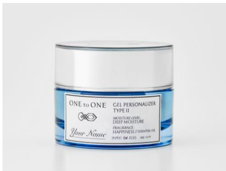
ゲルパーソナライザー

カスタム仕様で私のために選び抜かれた極上のクリーム 肌に溶け込んでモイスターバランスを整える。