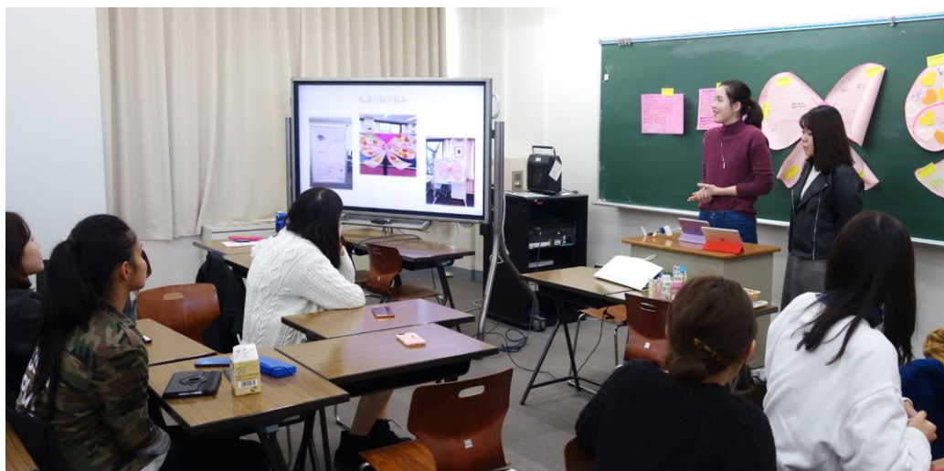
その後プレゼンを実施