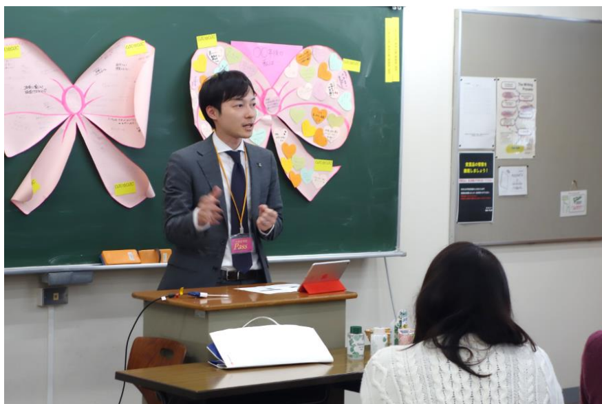
弊社からレビュー