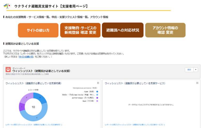
ウクライナ避難民支援サイト【支援者ページ】TOPページ