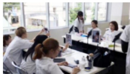
大阪美容専門学校での試験風景

「トレミラ(Tracing Mirror)」のリリースに先駆け、弊社同様に創業100年を超える美容学校である大阪美容専門学校の協力のもと、昨年春からメイク担当講師と生徒を対象に運用試験を実施しています。「トレミラ(Tracing Mirror)」の多くの機能が、この運用試験での反応を基に開発・改良されてきたものです。