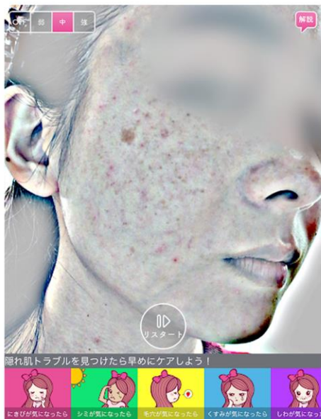
<フィルタON:メイク前>