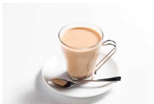
「バランス食堂&カフェ アスシヨク」で展開予定のメニュー3品 (上:フローラコラーゲンカレー、下左:ベリーフローラブリュレ、下右:フローラロイヤルミルクティー)