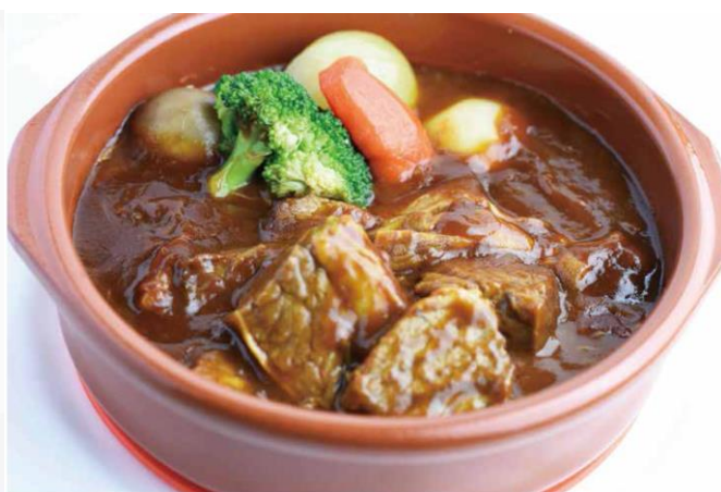
銀座木村家1Fデリカで展開する「黒毛和牛のハンバーグ」と「ビーフシチュー」 ※お持ち帰り用の包装で提供予定です。