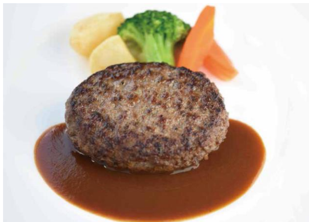
黒毛和牛のハンバーグ 1,500円(税込)