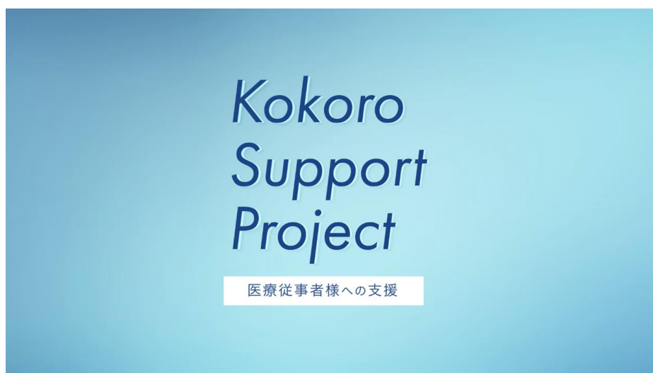
「Kokoro Support Project(ココロサポートプロジェクト)」を通じて様々な支援を行います

本年は厚生労働省が推進する対話型情報発信プロジェクト「#広がれありがとうの輪」に賛同し、より、サポートを強化してまいります。 https://www.youtube.com/watch?v=ZE60siRO4s4