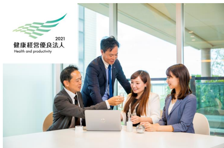
全社員が安心してイキイキと長く働くことができる環境を整えています

新型コロナウイルス感染症対策、病気治療と仕事の両立支援、労働時間管理、メンタルサポート、ワークライフバランス向上の推進、禁煙支援等の、当社が実施する健康に関する取り組みが評価され、認定に至りました。