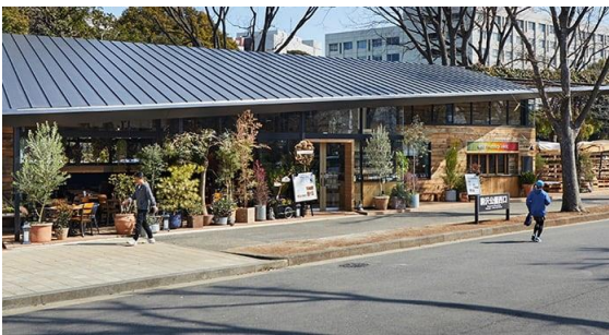
Mr.FARMER 駒沢店 東京都世田谷区駒沢公園 1-1-2 03-5432-7062