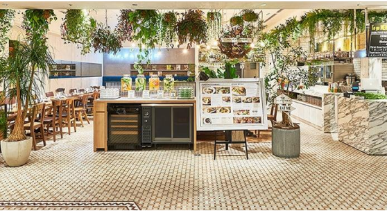
Mr.FARMER 日比谷店 東京都千代田区有楽町 1-1-2 東京ミッドタウン日比谷 B1F HIBIYA FOOD HALL 03-3519-3066