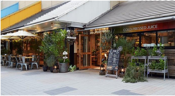
Mr.FARMER 新宿店 東京都新宿区西新宿 1-1-3 小田急新宿ミロード モザイク通り 03-3349-5731