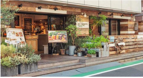
Mr.FARMER 表参道店 東京都渋谷区神宮前 4-5-12 セピア原宿 1F 03-5413-4215