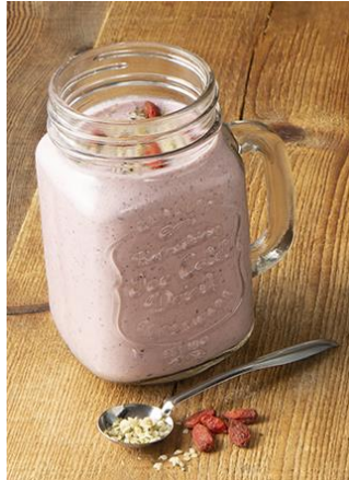
体の中からキレイに! 飲むだけで美肌に導く当社独自開発成分「フローラコントロール ISR」配合 美活スムージー“FLORA” 税込 979 円 (お持ち帰り 税込 961 円)

また7月10日~恵比寿店限定で、美活スムージー“FLORA”をご注文のお客さまへフローラコントロール ISR サプリ「RF28 インナースキンビューティフローラサプリメント」を、1包装プレゼントさせていただきます。