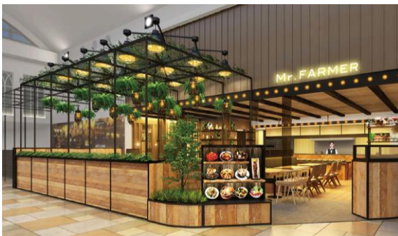
Mr.FARMER 恵比寿店 東京都渋谷区恵比寿南 1-5-5 アトレ恵比寿 6F 03-5475-8431

新型コロナウイルス感染症の拡大に伴い営業時間等に変更がございます。 詳細は Mr.FARMER 公式 HP よりご確認ください。