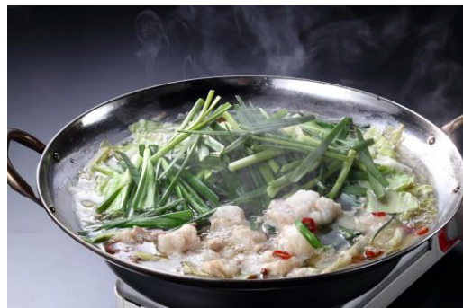
50年以上守り続ける鶏ガラと野菜で作った特製のスープに菌バランスを整える独自成分「フローラコントロールISR」を配合した「博多鶏だしもつ鍋」

※参照:令和2年度「食育に関する意識調査」の結果: https://www.maff.go.jp/j/press/syoutan/hyoji/210331.html