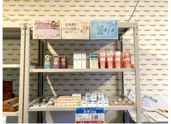
コミュニティフリッジにて 提供スタートした当社化粧品