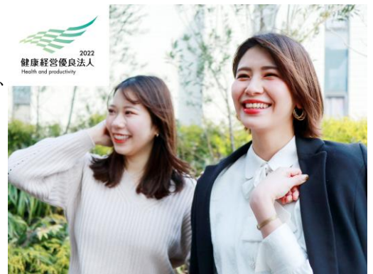
健康でイキイキと長く働くことが出来る環境を整備