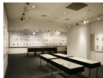
大阪企業家ミュージアム 特別展示会場