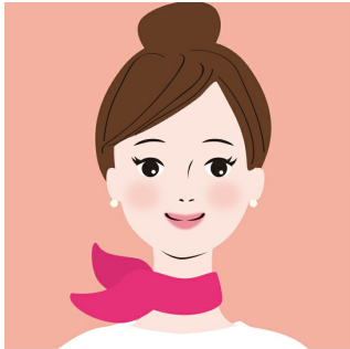
明色LINEチャットアイコン

以下アイコンのついている「明色化粧品 お客様相談室」アカウントが検索画面に表示されたら、アカウントをタップしてください。